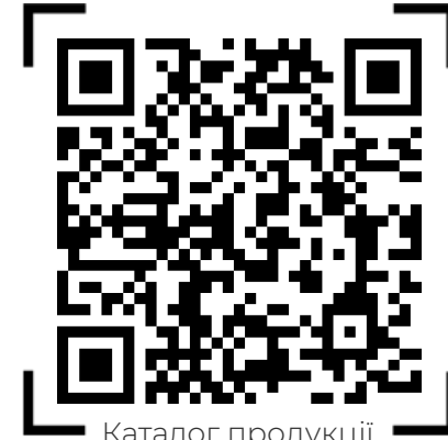
Каталог продукції (с. 38–64)

Наші спеціалісти можуть вирішити завдання будь-якої складності з врахуванням індивідуальних потреб замовника.