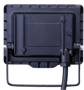
Essential SmartBright G3 LED Floodlight 10W