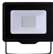
Essential SmartBright G3 LED Floodlight 10W 3