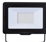
Essential SmartBright G3 LED Floodlight 3